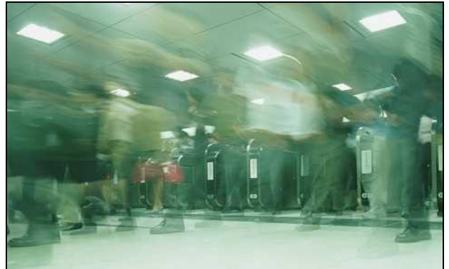
Neckloop-PTT для скрытого ношения

Это индуктивное устройство, предназначенное для сотрудников милиции. Подключается практически к любым аналоговым или цифровым рациям. Кнопка ответа с интегрированным микрофоном надёжно крепится к петле индуктивности и оснащена двумя разъёмами для внешних аксессуаров. Это позволяет расширить возможности продукта. Neckloop-PTT может использоваться для различных приложений и входит в линейку продуктов OnGuard.