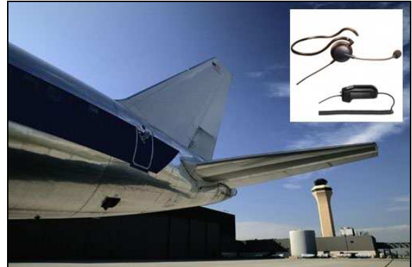
Применение AirTalk XSN с PTT-13 в авиадиспетчерских

AirTalk XSN – это очень лёгкая гарнитура с одним динамиком и креплением за шейю. Гибкое и прочное крепление за шейю не давит на голову. Вращающийся наушник расположен на правой стороне гарнитуры и комплектуется подушечками из кожзаменителя. Удобная конструкция гарнитуры предоставляет полный комфорт во время работы, поэтому оптимально соответствует требованиям в центрах управления полётами.