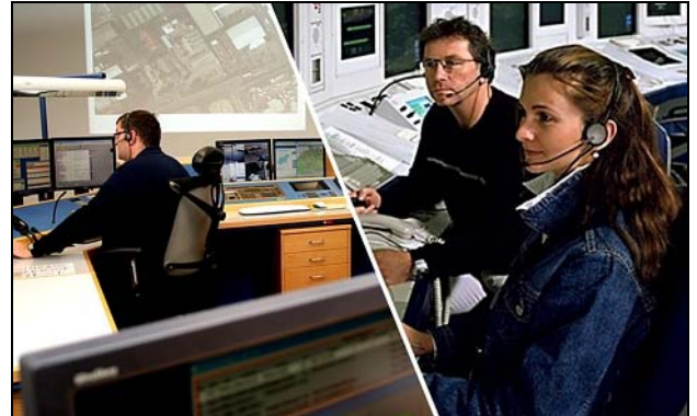
Использование в диспетчерских

TM2 - это филигранно выполненный, настольный микрофон из анодированного алюминия, что делает TM2 практичным и надёжным. Гибкий штатив позволяет выбрать нужное положение для микрофона. TM2 может поставляться как с кнопкой передачи, так и без.