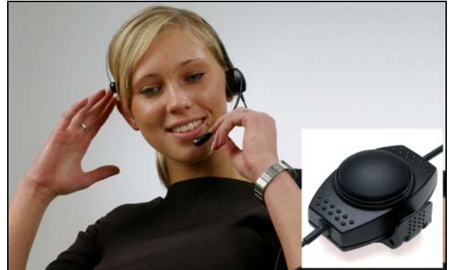
Apollo Headset / Кнопка ответа PTT-8

Apollo XD - это легкая гарнитура с двумя динамиками и электретным микрофоном, специальными распорками на оголовье, защитой от акустического шока, кожаными подушечками динамиков и возможностью персонализации. Всё это позволяет достичь высокого качества связи и комфорта при использовании гарнитуры.