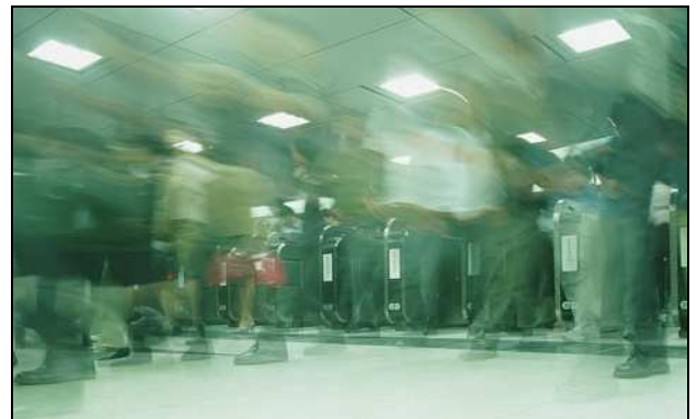
Neckloop-PTT im verdeckten Einsatz

Entwickelt für diskrete Kommunikation in Polizeieinsätzen kann die Neckloop-PTT mit allen gängigen Funkgeräten verwendet werden. Die Sendetaste mit integriertem Mikrofon ist direkt mit der Umhängespule verbunden und enthält außerdem noch eine 3,5 mm Buchse für einen externen Ohrhörer (DE224). Dadurch ist eine vielseitige Verwendung dieser Garnitur gewährleistet. Mit diesen flexiblen Einsatzmöglichkeiten rundet die Neckloop-PTT die OnGuard-Serie als Allround-Garnitur ab.